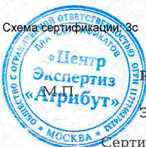
Схема сертификации, 3с